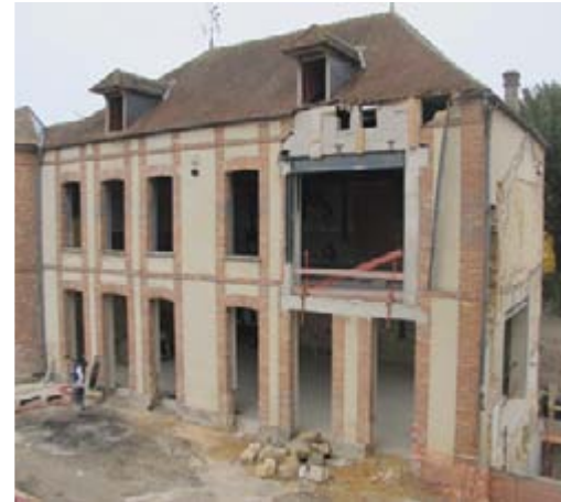
Au 1 er étage du bâtiment de la terrasse, un trou béant annonce la future galerie vitrée