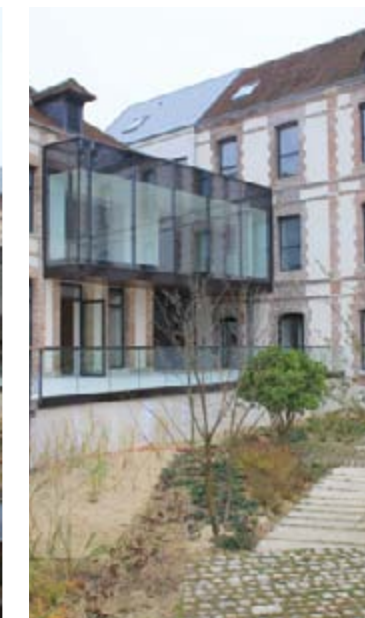
Cette fois, ça y est ! les plantes sont en place !