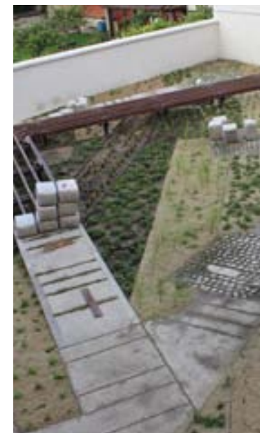
Un généreux paillis de lin pour les parterres