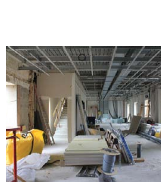
Le croiriez-vous ? Ce sera bientôt l'espace enfants de la médiathèque...