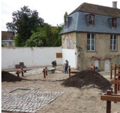
Dans le jardin, des pavés pour les placettes et un riche terreau