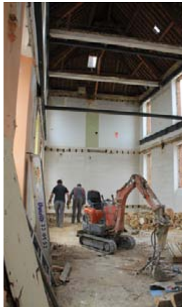
Il ne reste plus que le sol en terre battue, les murs nus et la charpente...