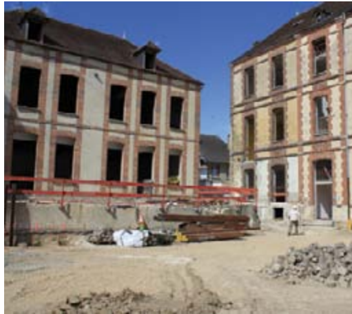
Premiers coups de bulldozer et de pelleteuse dans la cour