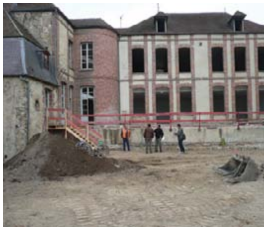
Les enrobés de la vieille cour ont disparu