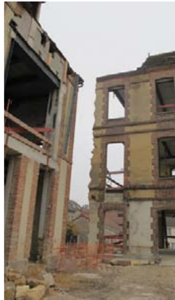
Il ne reste plus qu'une carcasse..