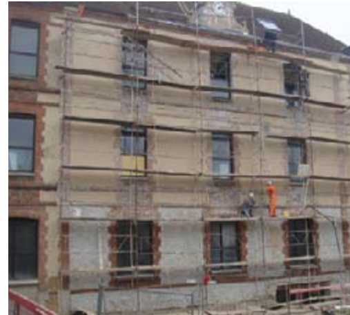
Les nouvelles fenêtres sont installées, les enduits sont en cours