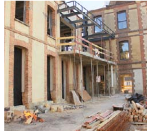
L'armature métallique de la galerie vitrée se met en place