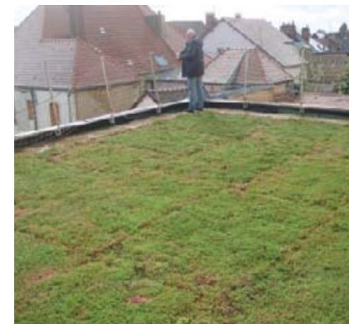
Sur la salle des périodiques, une toiture végétalisée