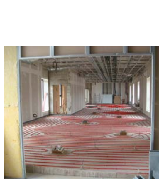
Au 1 er niveau de la médiathèque, des dizaines de mètres de tuyaux pour le plancher chauffant