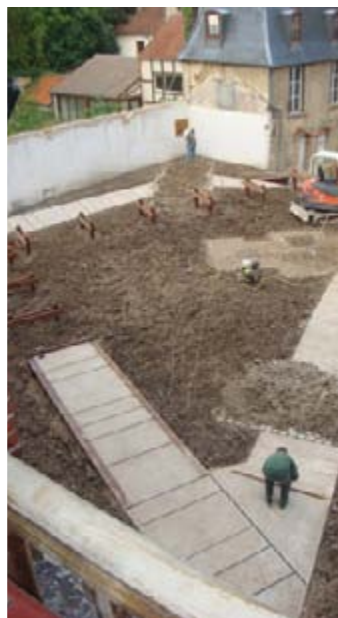
Le jardin est maintenant nettement tracé