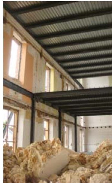
Une solide structure métallique pour les nouveaux planchers