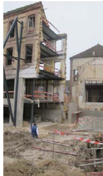
En attente de la future extension (côté rue Paul Doumer)