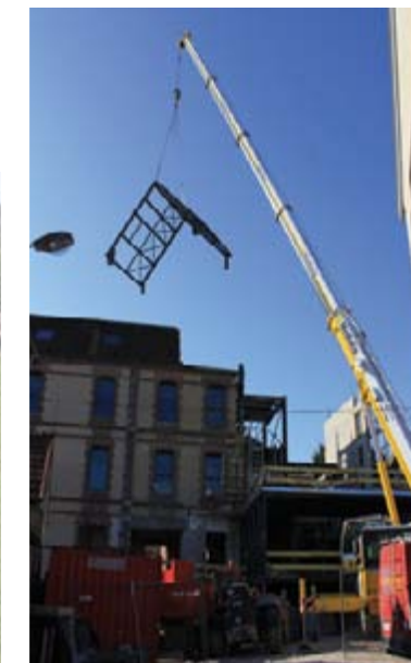
Dans les airs, la charpente métallique de l'extension de l'aile «est»...