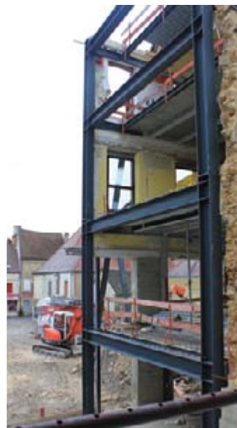
Une armature métallique annonce la future extension