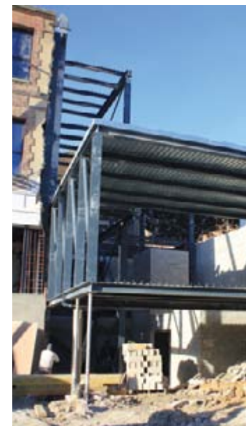
La future salle des périodiques surplombe déjà le parvis