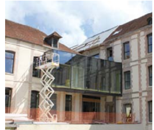
Dernières vérifications des vitres de la galerie