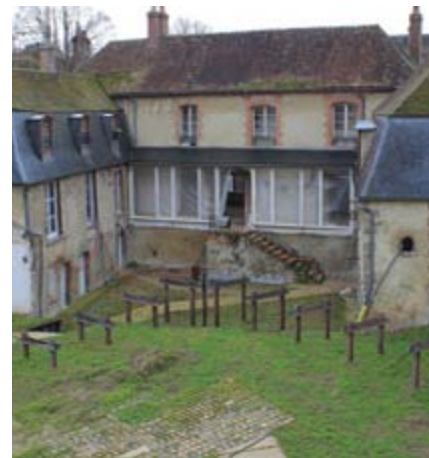
Les pilotis de la future passerelle sont installés