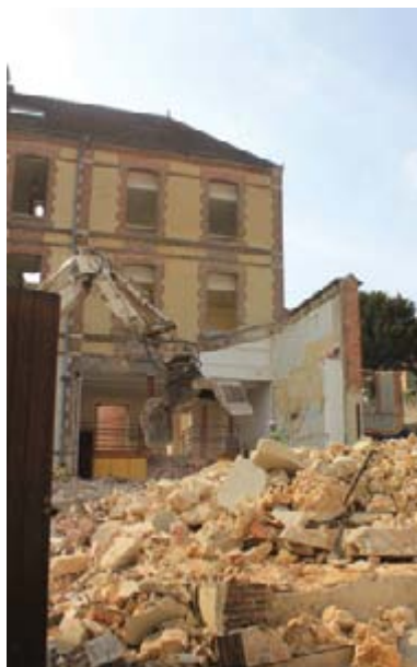
Côté rue Paul Doumer, on démolit le mur et l'ancien atelier «bois et fer»