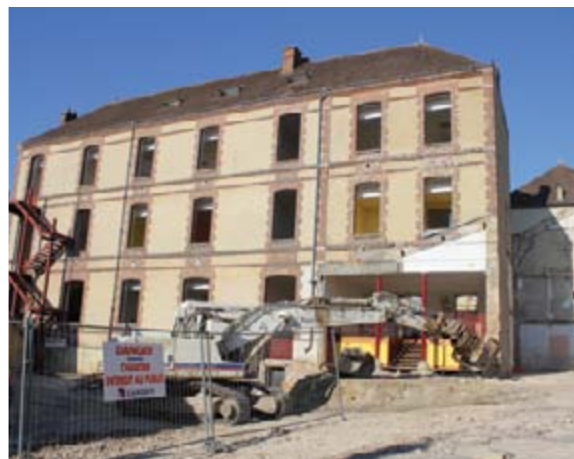
La façade arrière de l'aile «est» s'offre enfin entièrement aux regards