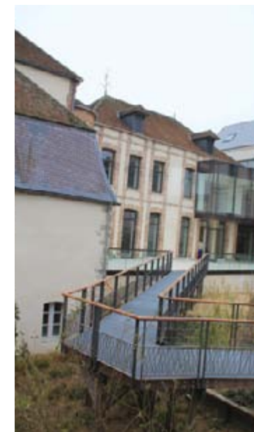
La passerelle court de la terrasse au cœur du jardin