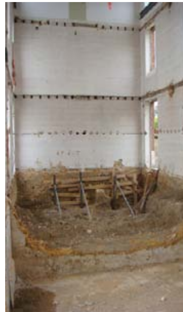
Tous les vieux planchers ont été démontés